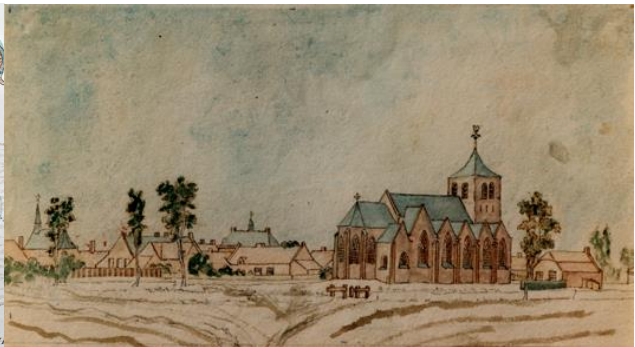
Zicht op Budel, 1829 *)

De Brabantse hertog en plaatselijke heren gaven vanaf circa 1300 in Peelland gemeenschappelijke gronden uit aan groepen individuen, maar vooral aan lokale gemeenschappen. De aktes waarin de uitgifte en de bevoegdheid tot beheer van deze gemeintes zijn vastgelegd, bevatten vaak de oudste gegevens over het leven in de gemeenschappen. De gemeenschappelijke gronden waren eeuwenlang van groot belang voor de kleine landbouwbedrijven op de schrale Peellandse gronden. Dit gemeenschappelijke gebruik vereiste een goede organisatie. Die kreeg vorm in jaargeboden, de jaarlijks vernieuwde regels voor het gebruik van de gemeint, die in veel Peellandse gemeenschappen bewaard zijn gebleven.