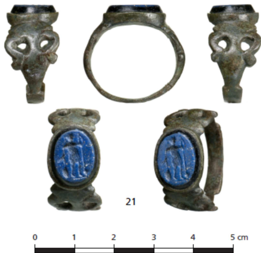
Afb. 7.22 Budel-Noord, Duitse school, bronzen ring met gem, vondst 21.

De potstal van huis 8 bleek 70 cm diep bewaard te zijn gebleven. Omdat dit een uitzonderlijk goede conservering is, werd in het veld besloten om een intensief onderzoek uit te voeren naar het gebruik van deze stal. Van de potstal zijn monsters genomen voor botanisch, palynologisch en micromorfologisch onderzoek. De botanische monsters hebben vooral pluimgierst en wat gerst en granen opgeleverd. Micromorfologisch onderzoek heeft aangetoond dat de vloer van de stal aangestampt is waardoor een compacte laag is ontstaan. De grote hoeveelheid houtskool van vermoedelijk eik in de potstal lijkt er op te wijzen dat de boerderij (deels) is afgebrand. Nadat de boerderij buiten gebruik was geraakt is de potstal opgevuld met een laagje stuifzand om vervolgens nog eeuwenlang herkenbaar te blijven in het landschap als lokale depressie. In de Late Middeleeuwen is het terrein als akker in gebruik genomen en daarbij is het terrein met plaggen en mest opgehoogd.