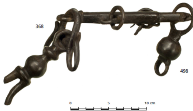
Afb. 7.16 Budel-Noord, Duitse school, Romeinse schuifbalans, vondst 368.

periode de potstallen van Huis 10/11 zijn verspit. Mogelijk waren de toenmalige bewoners op zoek naar bruikbaar materiaal zoals metalen voorwerpen en/of bouwmaterialen.