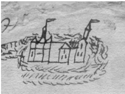
Kasteel Grevenbroek, tekening 1606

op dinsdag 30 april aanstaande om 20.00 uur in zaal "Bellevue", Maarheezeweg 1 te Budel.