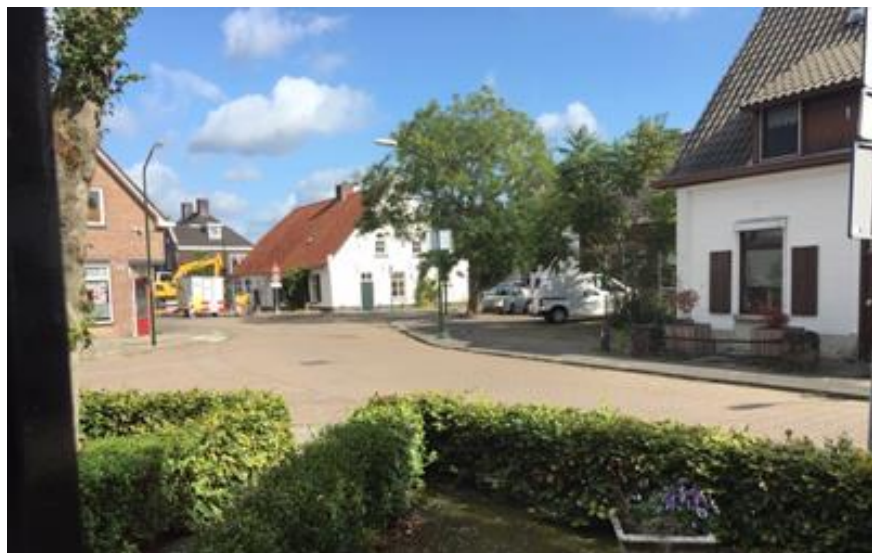
Opgraving Dorpsstraat Budel

In juni werd het pand op de hoek Mathijssenstraat-Van Baarsstraat gesloopt. Ook hier hebben leden van onze kring en werkgroep waarnemingen verricht. Bij sloop is helaas geen vergunning nodig maar kan volstaan worden met een melding. Daar kan geen archeologisch onderzoek worden opgelegd.