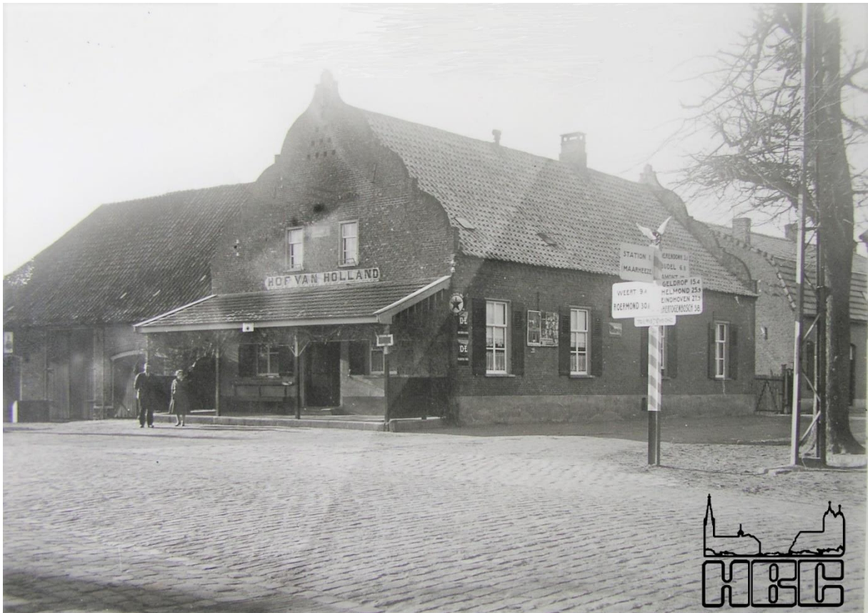
Foto vanaf de Leenderweg ca. 1935