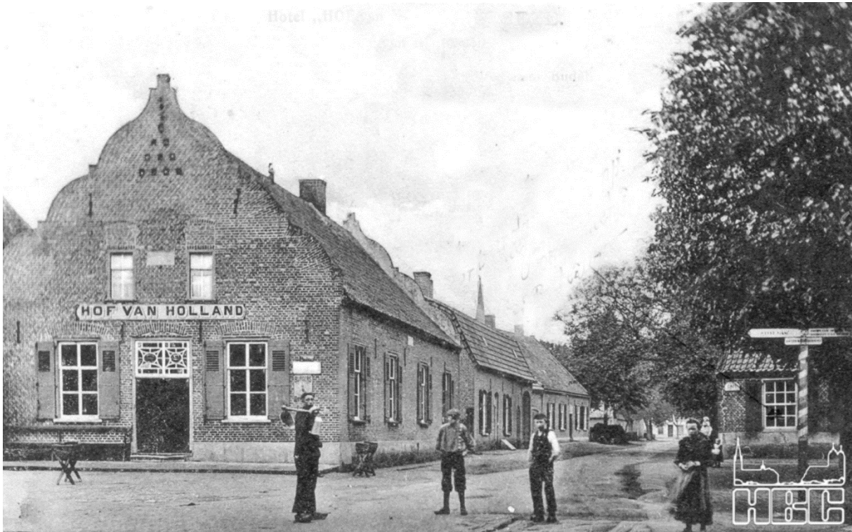
Prentbriefkaart ca. 1910

Het historische café-restaurant (voorheen ook logement) 'Hof van Holland' (Oranje Nassaulaan 1, Maarheeze) is een rijk pand, mogelijk uit 1734. Het werd mogelijk als 'teutenhuis' gebouwd. Van de kopse, in- en uitgezwenkte gevels heeft de oostelijke (de gevel met de hoofdingang) duivenopeningen.