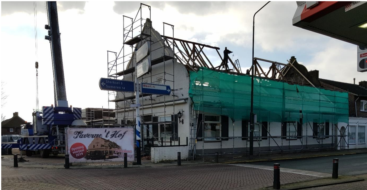
Vebouwing 2019

In 2019 werd het opnieuw verbouwd en heet het voortaan Taverne 't Hof.