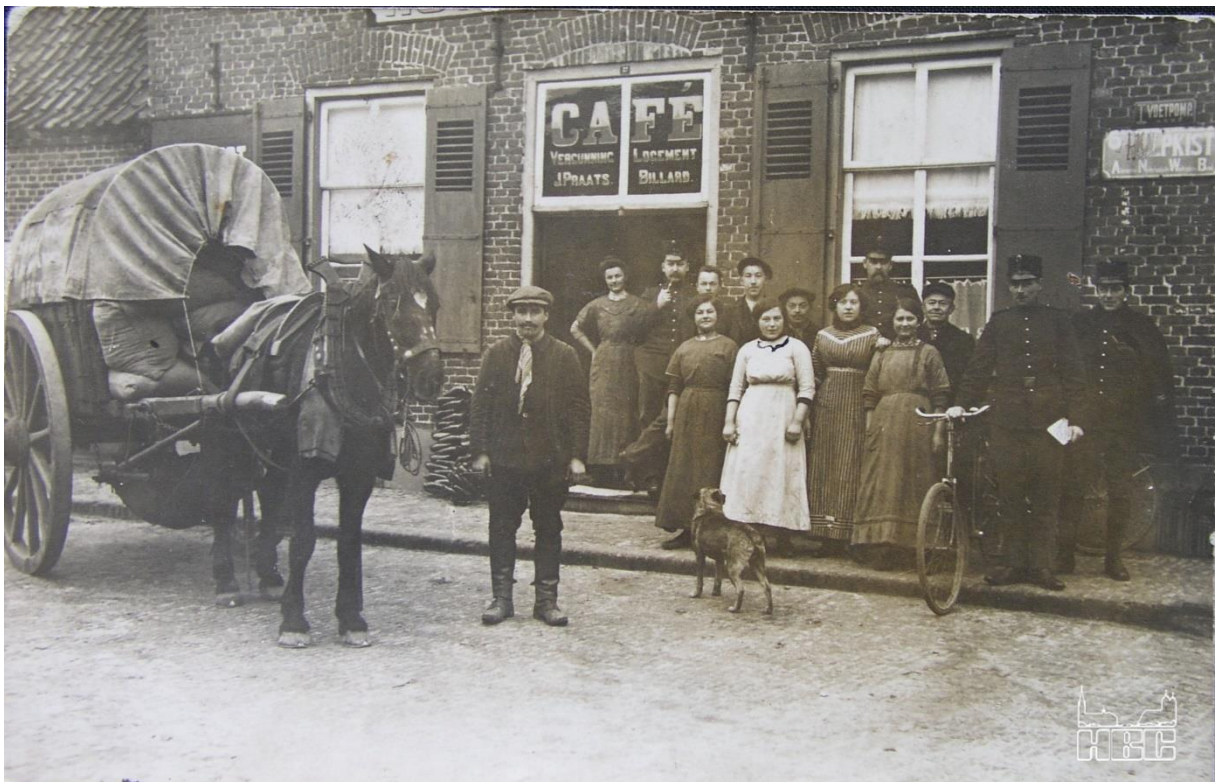
Drukke voor 't Hof in de periode 1914-1918