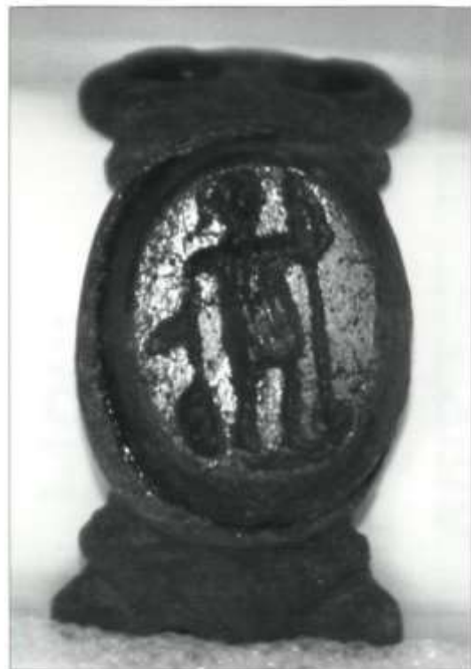
Bronzen ring met gem. zand

Heemkundekring 'De Baronie van Cranendonck'