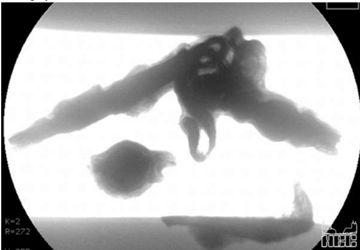
Röntgenfoto van een metalen unster (type weegschaal)

huis 11 lag en vice-versa. Deze huizen dateren rond het einde van de tweede of het begin van de derde eeuw na Chr. In de sporen van dit huis is echter ook een aardewerksoort aangetroffen die eerder in de Merovingische periode thuishoort. Vermoedelijk zijn hier in de zesde eeuw na Chr. Frankische boeren neergestreken. Mogelijk hebben ze nog resten herkend van de nederzetting die hier bijna driehonderd jaar eerder lag. Uit vondsten van Romeinse dakpan en ander bouw materiaal in de meeste vroeg en vol middeleeuwse nederzettingen in Brabant blijkt dat in deze periode Romeinse resten systematisch worden ontdaan van waardevolle voorwerpen die zijn achter gebleven. In eerste instantie zal zijn gezocht naar (edel)metalen, maar ook naar bouwmaterialen en mogelijk bruikbaar of versierd aardewerk.