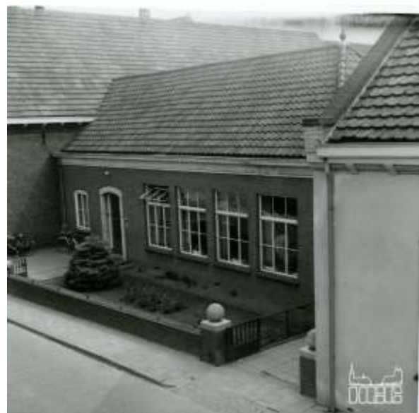
De nieuwe St Jozef kleuterschool 1953