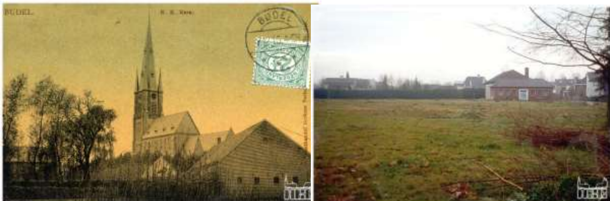
Boerderij en landerijen bij het klooster

Na vele uitbreidingen werd het een samengesteld gebouw met kloosterruimten, scholen, een weeshuis voor meisjes, een kapel en een bejaardenhuis. In 1896 lieten de zusters achter in de hof een boerderij bouwen, die in 1961 is gesloopt. Achter het kerkhof aan de huidige Willem II straat hadden zij landerijen. (nu Zustershof)