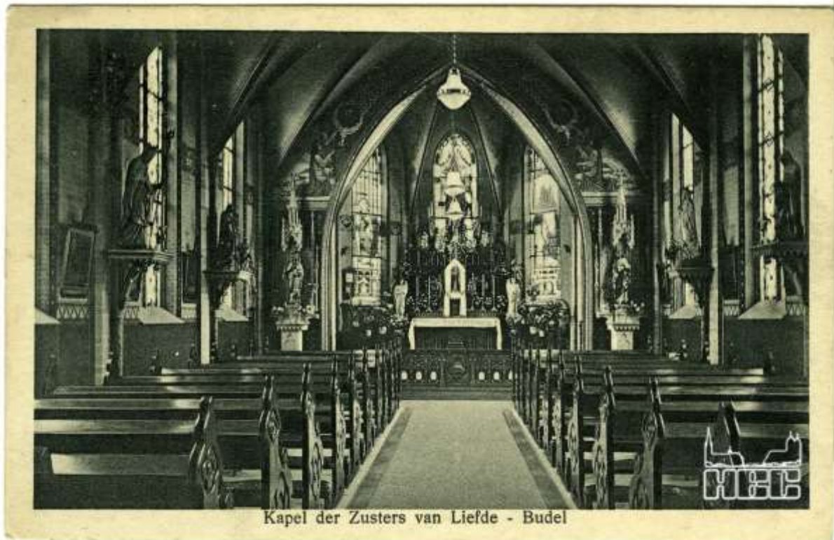
Kapel der Zusters van Liefde - Budel

met de belendende scholen is te talrijk om hier allemaal te vermelden. De kapel werd in 1964 verbouwd, kreeg in 1968 opnieuw een opknapbeurt en een nieuwe vloer.