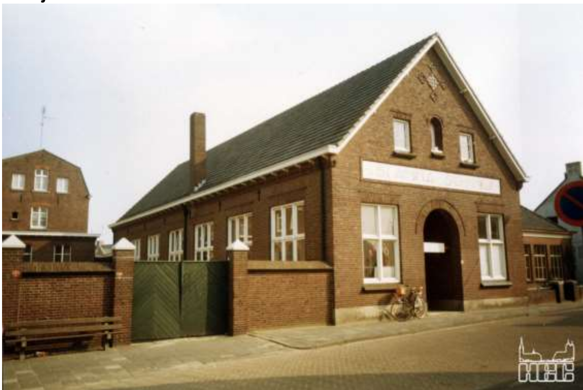
De Sint Annaschool met uiterst rechts de Sint Jozef Kleuterschool

Heemkundekring 'De Baronie van Cranendonck'