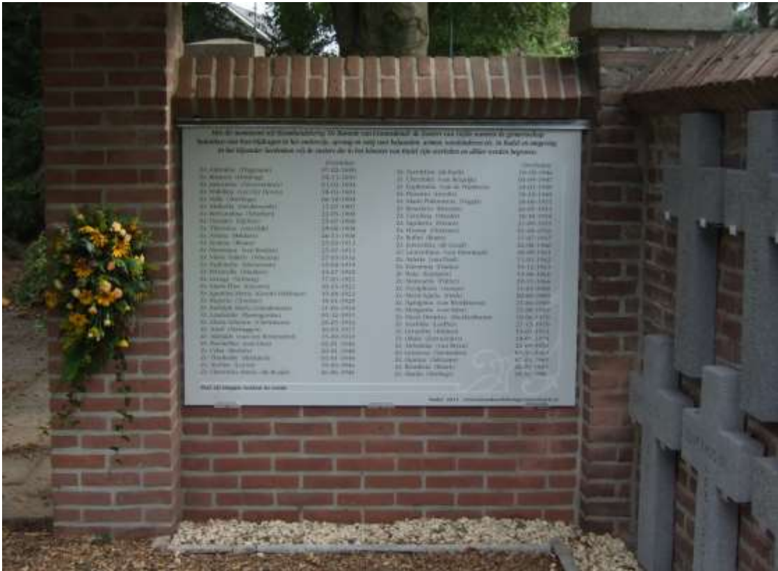
Zustermonument op de begraafplaats bij de kerk OLV Visitatie Budel

Zie ook Historie zusters van Liefde in Budel!