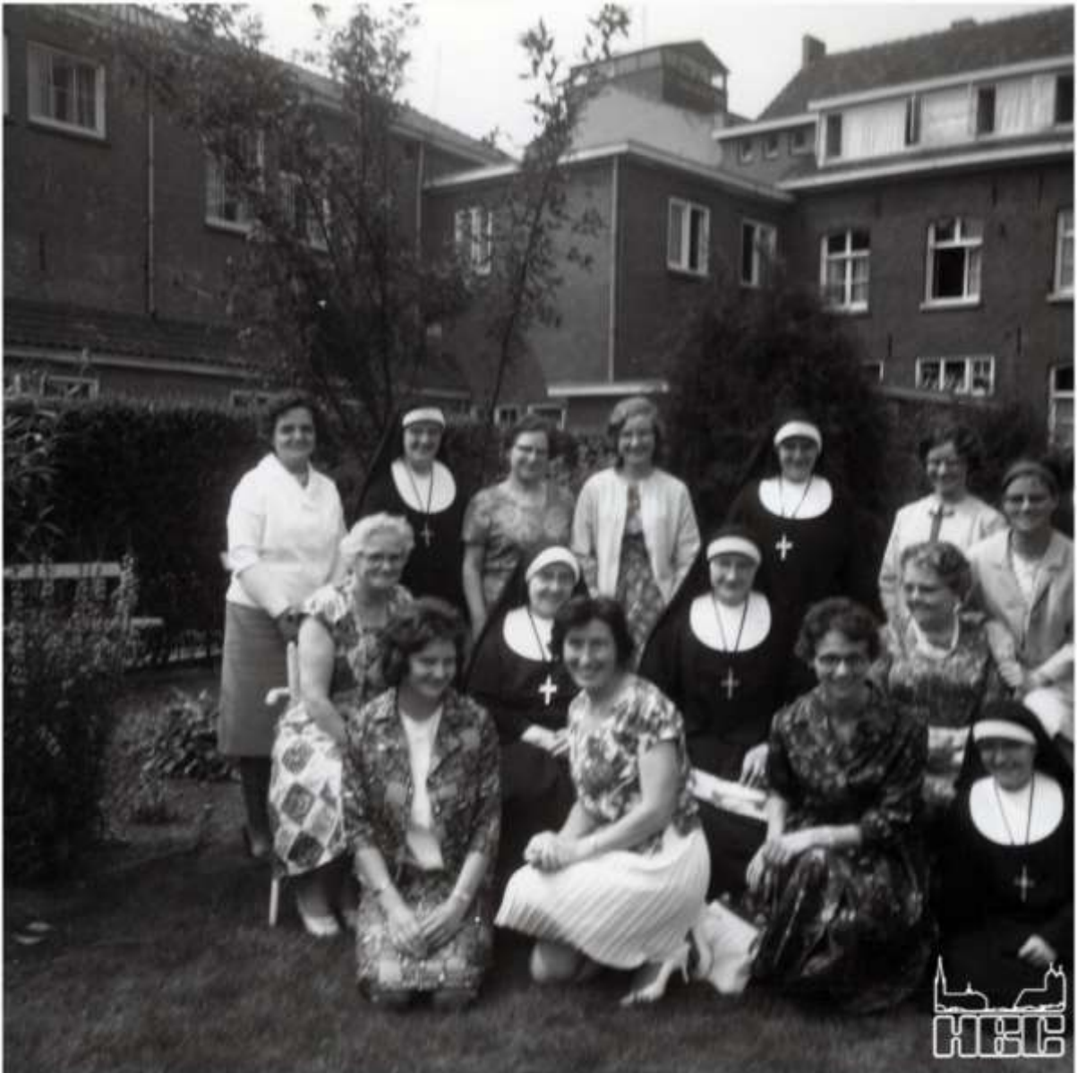
Team Sint Annaschool in de kloostertuin.