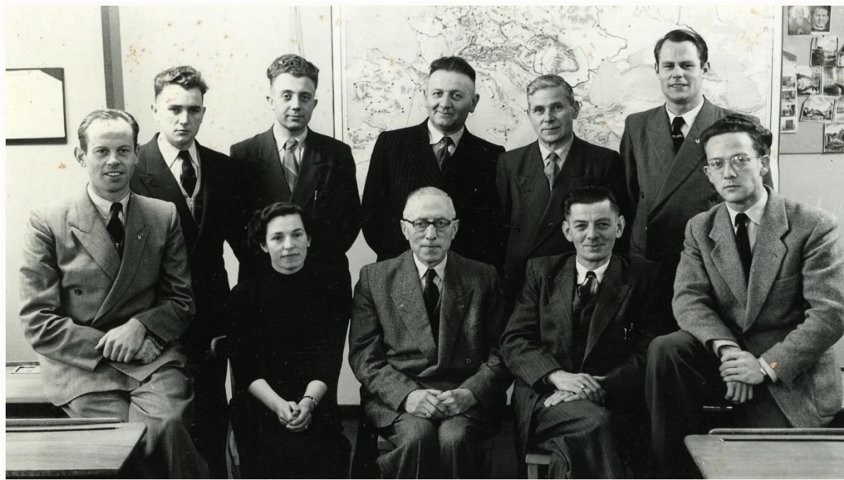
Team Aloysiuschool Budel 1954