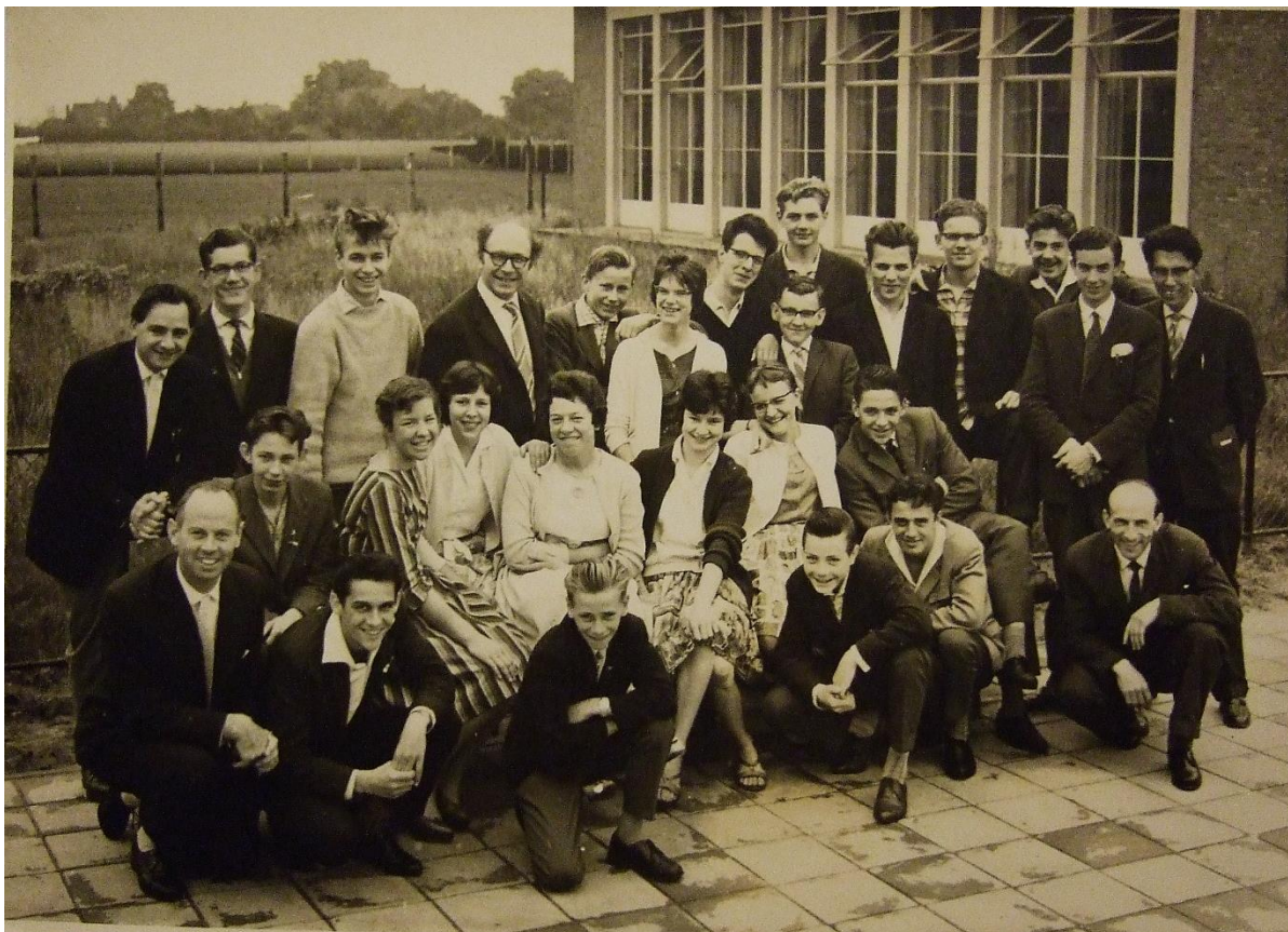
MULO St, Oda 1960