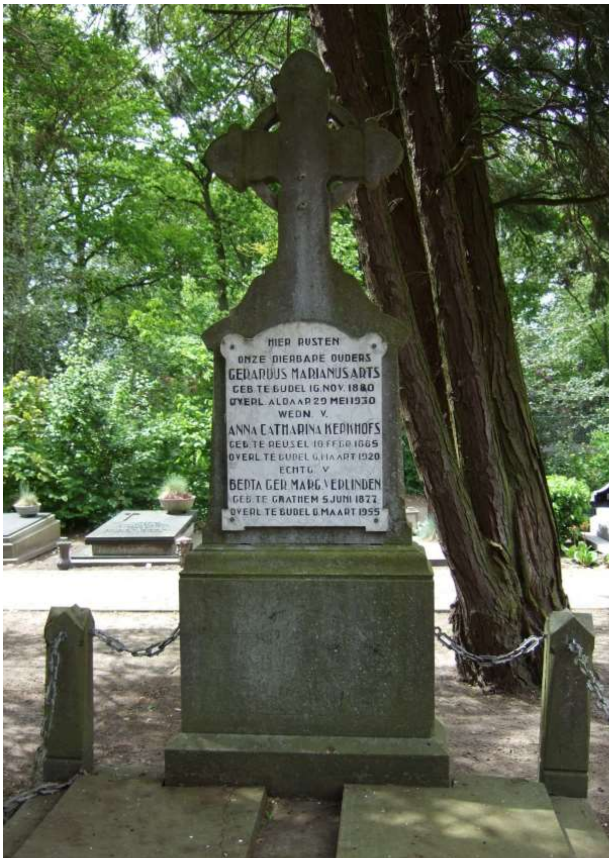
Heemkundekring 'De Baronie van Cranendonck' https://heemkundekringcranendonck.nl