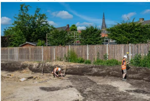
▲ Aan de Hanendijk in Budel zijn restanten gevonden van middeleeuwse gebouwen.

De opgraving aan de Hanendijk, waarbij gebouwsporen uit de twaalfde en dertiende eeuw werden ontdekt, kwam ook in de pers aan bod. Nadat op 12 en 13 maart proefsleuven waren getrokken werd besloten tot een opgraving, die plaatsvond van 16 tot en met 22 juni.