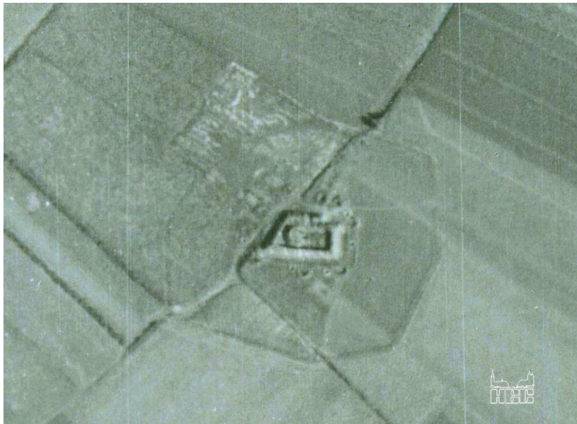
Fragment van een van de luchtfoto's van 11 september 1944 met daarop het mysterieuze object in de akkers van Budel-Schoot

Continu was hij aan het rondkijken of hij niet opgemerkt zou worden. Het was erg koud op 8½ kilometer hoogte. Het “gejank” dat de Duitse radarinstallaties veroorzaakte in zijn hoofdtelefoon, maakte het er ook niet leuker op. Ondanks al het bekende gevaar was hij op maandagochtend 11 september 1944 om 9.00 uur vanaf vliegbasis Benson (UK) vertrokken. In zijn Spitfire van de Royal Air Force zou hij over onze dorpen gaan vliegen. Omstreeks 10.40 uur had hij de zinkfabriek bereikt. En nu vloog hij over Budel-Schoot. Met een grondsnelheid van ongeveer 440 kilometer per uur zou hij zo meteen ook nog over Budel, Soerendonk en Maarheeze gaan vliegen. Achter de stuurknuppel van het verkenningsvliegtuig zat Flight Sergeant Ken Nichol. Pas 24 jaar oud was hij. Direct achter zijn pilootenstoel stonden twee reusachtige camera's opgesteld. Elke 6 seconden maken die twee camera's foto's van het grondgebied. Het lawaai van de filmtransportmotoren en de mechanische sluiters zal Ken niet horen. Uiteraard zal zijn hoofdtelefoon het geluid “buiten” houden. Anders zou het zeker overstemd worden door het geluid van de motor. In dit geval een Rolls-Royce Merlin 63 (V12 – 27 liter – 1.710 PK). Waarschijnlijk heeft Ken niet gezien dat hij een bijzonder object op de gevoelige plaat zal vastleggen. Het object is gelegen tussen de Grootshoterstraat (nu Poelderstraat) en de Zwarteweg.