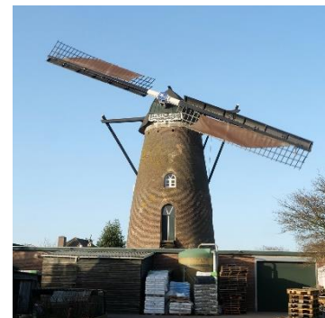
Renovatie molen Zeldenrust