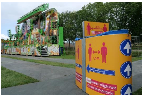
Kermis op het evenemententerrein

Ook hebben we vrijwel geen evenementen kunnen vastleggen, vanwege het verbod hierop. Een uitzondering was de "coronakermis" op het evenemententerrein.