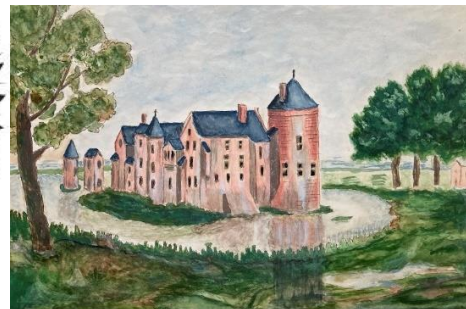
Oudste tekst Budel 779