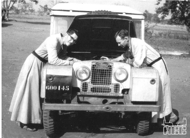
Reparatie van de jeep